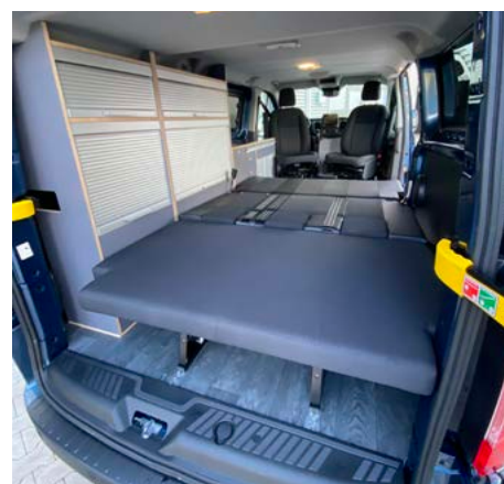
Die Smartseat Sitz- und Schlafbank bietet eine bequeme und großzügige Liegefläche. Schrankmodul mit platzsparenden Rollladentüren.