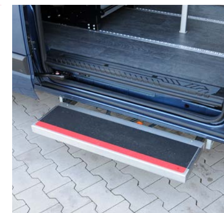
Die elektrische Trittstufe für die Seitenschiebetür ermöglicht einen leichten Einstieg.