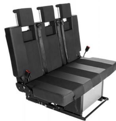
Die Sitz-/Schlafbank verfügt über integrierte Sicherheitsgurte und höhenverstellbare Kopfstützen. Eine Schublade unter der Sitzfläche sorgt für extra Stauraum.