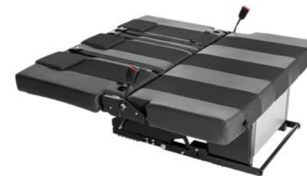
Mit dem zusätzlichen Flexboard kann die komfortable Sitz-/Schlafbank auf eine Liegefläche von ca. 130 cm x 190 cm erweitert werden.