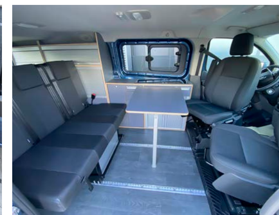
Die leicht verschiebbare 3er Sitzbank, der Klapptisch und der drehbare Fahrer- und Beifahrersitz ermöglichen eine flexible Nutzung.